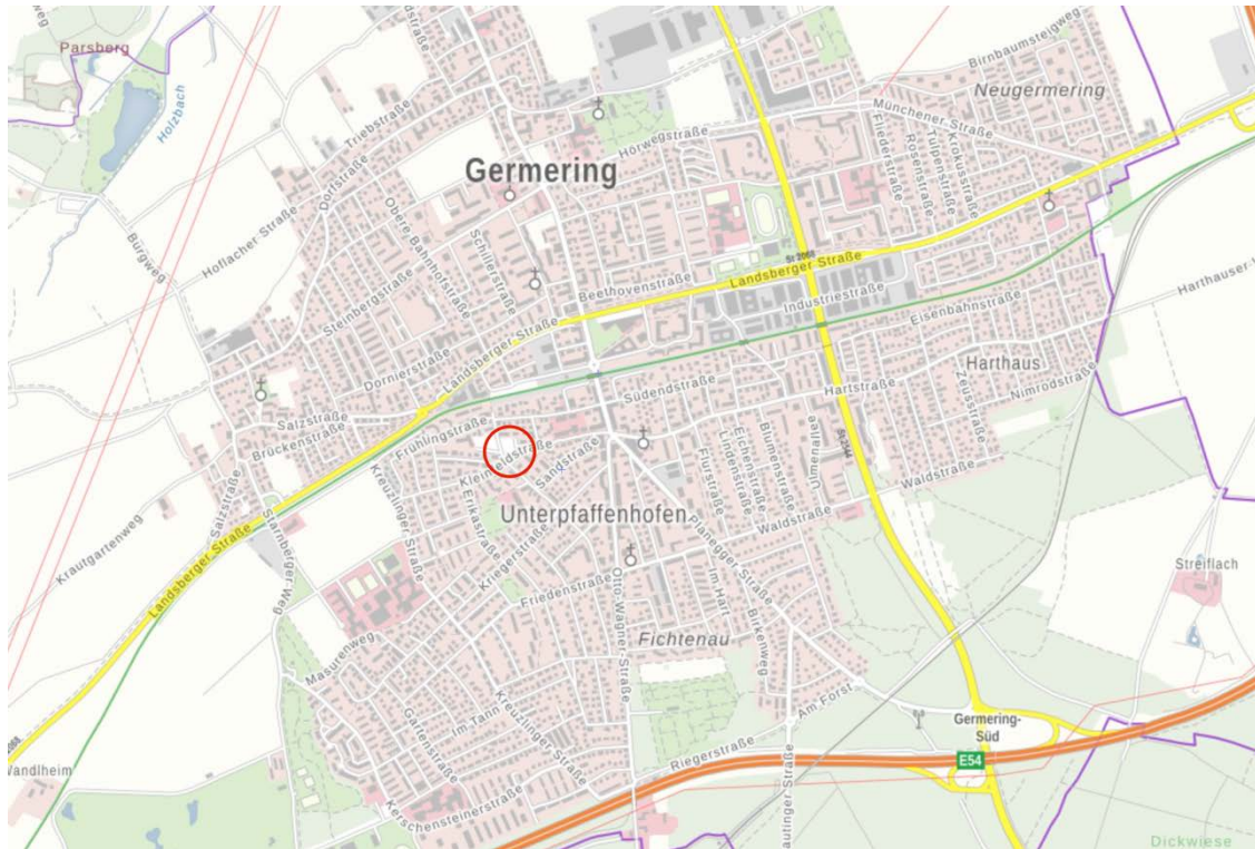
Lage des Planungsgebiets in Topographischer Karte, o.M.

Das Planungsgebiet liegt im Ortsteil Unterpaffenhofen, nahe der in Ost-West-Richtung verlaufenden S-Bahnlinie S8 und etwa 300 m südwestlich des S-Bahn-Haltepunkts Germering-Unterpaffenhofen. Im Westen wird das Planungsgebiet von der Marktstraße, im Nordosten von einem Wohngebiet, bzw. einer Anliegerstraße mit Garagen, begrenzt. Im Süden grenzt ebenfalls Wohnbebauung an das Planungsgebiet an.