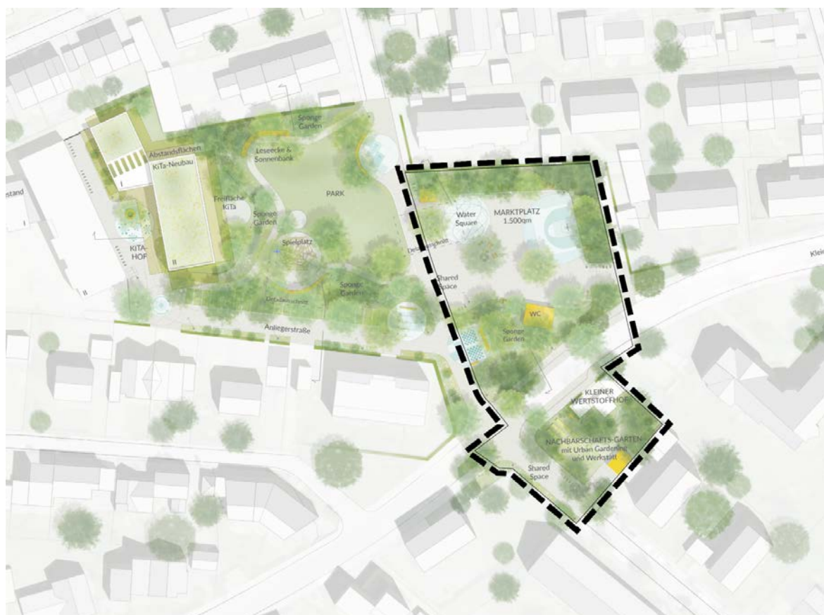
Entwurf Nicole M. Meier Landschaftsarchitektur mit von Angerer Architekten und Stadtplaner, o.M.

Der Entwurf des Bebauungsplanes basiert auf dem Siegerentwurf von Nicole M. Meier Landschaftsarchitektur, München, mit von Angerer Architekten und Stadtplaner aus dem Wettbewerbsverfahren im Sommer 2023.