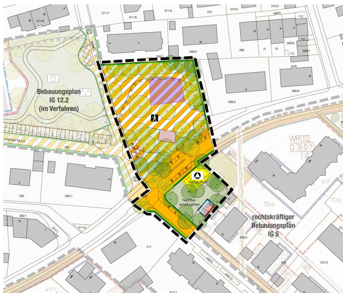
Planzeichnung Bauungsplanentwurf, o.M.