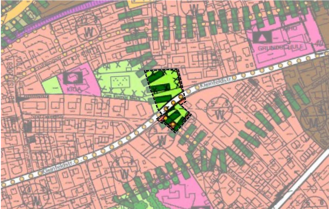
Ausschnitt aktuell gültiger Flächennutzungsplan mit Geltungsbereich Bebauungsplan IG 12.3, o.M.

Im derzeit gültigen Flächennutzungsplan der Stadt Germering ist das Planungsgebiet als öffentliche Grünfläche mit der Zweckbestimmung Parkanlage sowie die Kleinfeldstraße als wichtige örtliche Straße und wichtige Fuß- und Radwegverbindung dargestellt. Nördlich der Kleinfeldstraße soll der Marktplatz nun als öffentlich Verkehrsfläche mit der Bezeichnung „Fußgängerbereich (Markt)“ ausgewiesen werden. Der Flächennutzungsplan wird im Rahmen der Bauleitplanung gemäß § 13 a Abs. 2 Nr. 2 BauGB nachträglich angepasst.